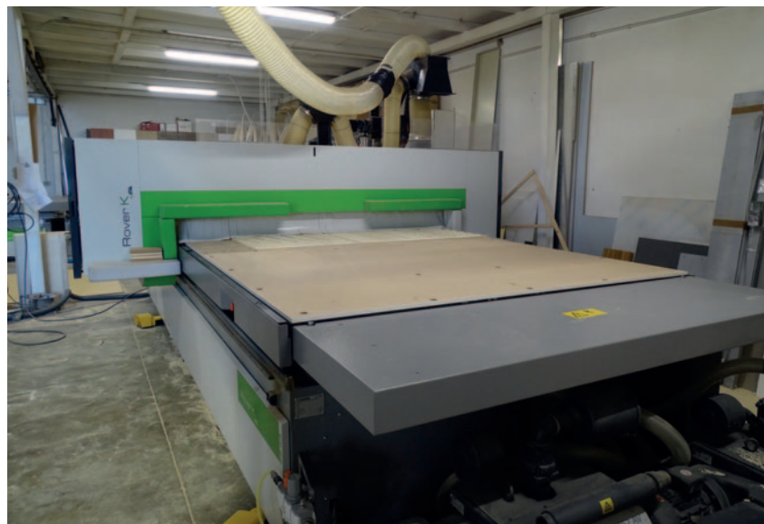
Aspetti dello stabilimento TCS.